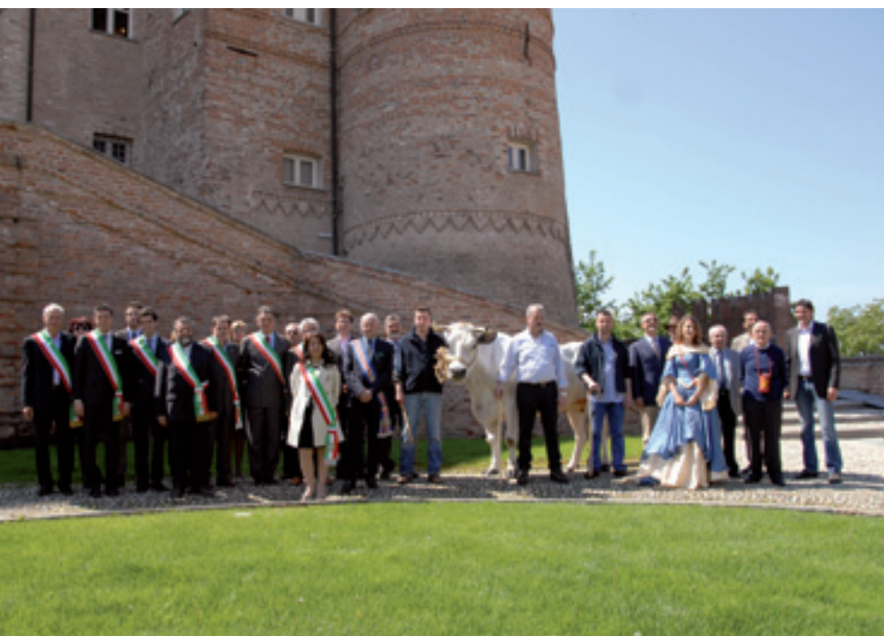
Foto di gruppo ai piedi del castello con i protagonisti della Fiera nazionale del Bue Grasso di Carrù, che il 15 dicembre 2011 celebrerà la sua 101 ma edizione.

C omincia con l'autunno la lunga stagione gastronomica della carne Piemontese, una razza speciale che negli ultimi due secoli si è qualificata a livello mondiale per le sue attitudini nutrizionali. Stagione autunnale e invernale perché sono i momenti in cui si preferisce puntare su un'alimentazione più proteica, ma la verità contemporanea è in evoluzione.